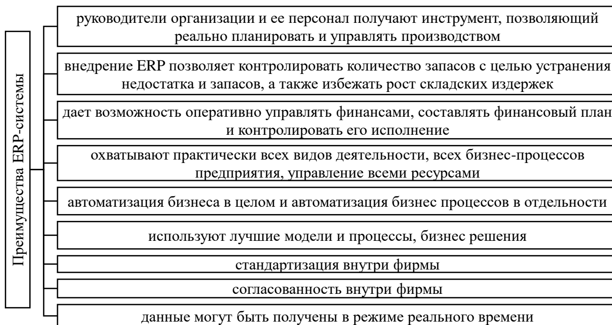
Рисунок 4 – Основные преимущества внедрения ERP-системы в ООО «Арт» [5]

минимизация потерь товаров. С целью минимизации потерь товаров предлагается внедрить ERP-систему, преимущества которой представлены на рисунке 4.