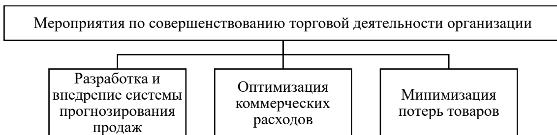
Рисунок 1 – Мероприятия по совершенствованию торговой деятельности ООО «Арт»

Риски возникновения подобных проблем и недостатков могут спровоцировать возникновение угроз для дальнейшего функционирования ООО «Арт». В связи с этим необходимо совершенствовать учетно-аналитическое обеспечение, чтобы выявлять источники подобных проблем. В связи с тем, что выявленные проблемы и недостатки характеризуются наличием причинно-следственных связей, в частности, получение убытков деятельности свидетельствует о нерентабельности деятельности, то необходимо выделить отдельные мероприятия по совершенствованию деятельности организации (рисунок 1).