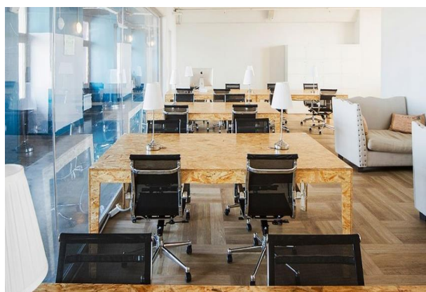
Рисунок 6 – Общий зал в коворкинге Рабочая Станция в Москве Источник [7]