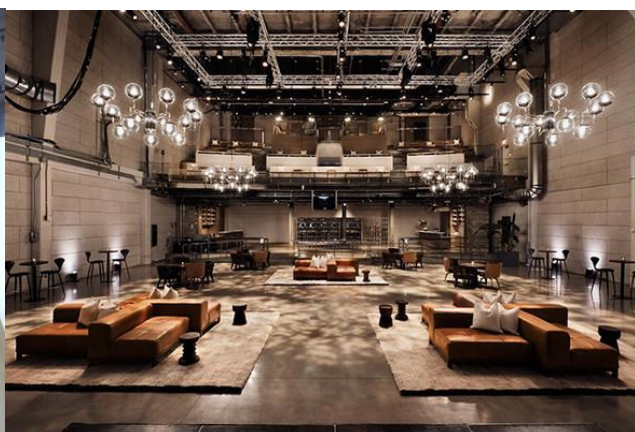
Рисунок 2 – Общий зал в коворкинге «NeueHouse».