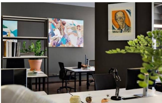
Рисунок 5 – Компьютерный зал коворкинга Ключ в Москве

Рассмотрим общий зал на примере столичного коворкинга Рабочая Станция в (см. рисунок 6). Это пространство сделано безукоризненно: присутствуют подвижные кресла, широкие столы, а также диваны, где посетители могут передохнуть в перерыве между работой [7].