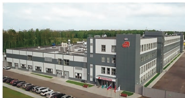
Рис. 9. Главное здание «АО ИЦ «Буревестник».