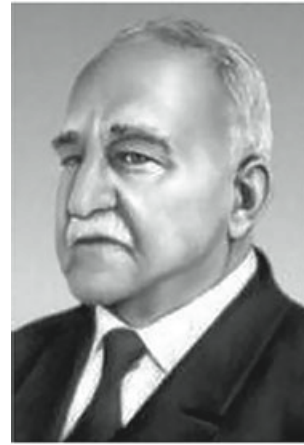
Рис. 5. Лебедев Александр Алексеевич 1893-1969 гг. Доктор физико-математических наук, академик АН СССР. Герой Социалистического Труда. Награждён: 5 орденов Ленина, 3 ордена Трудового Красного Знамени, орден Знак Почета. Ленинская премия и 2 Сталинские премии.