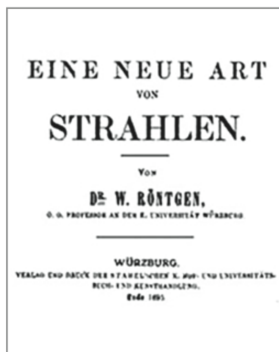
Рис. 1. Титульный лист брошюры «О новом роде лучей». Fig. 1. Title sheet of the "About the new kind of rays" brochure.

Поскольку катодные лучи были открыты ещё в 1859 г. Юлиусом Плюккером [7], многие исследователи, работающие с катодными лучами и с возникающим при этом рентгеновским излучением, ещё до В.К. Рентгена стояли на пороге открытия всепроникающих лучей, но не смогли распорядиться своими исследованиями должным образом [6]. Публикуемые работы по этим исследованиям читали все физики, кто занимался катодными лучами, и видели свечение экрана и почернение фотопластинок, а занимались ими почти все физики, и ни у кого не появилась такая «наивная» мысль, какая появилась у Рентгена: а почему экран светится? Им был сделан вывод, что не катодные лучи вызывали порчу фотопластинок, а новые, неизвестные.