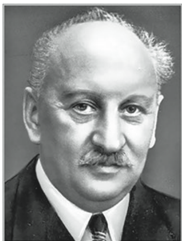
Рис. 3. Иоффе Абрам Федорович 1889-1960 гг. Доктор физико-математических наук, академик АН СССР. Заслуженный деятель науки РСФСР. Герой Социалистического труда. Лауреат Сталинской и Ленинской премий. Награждён: 3 ордена Ленина.