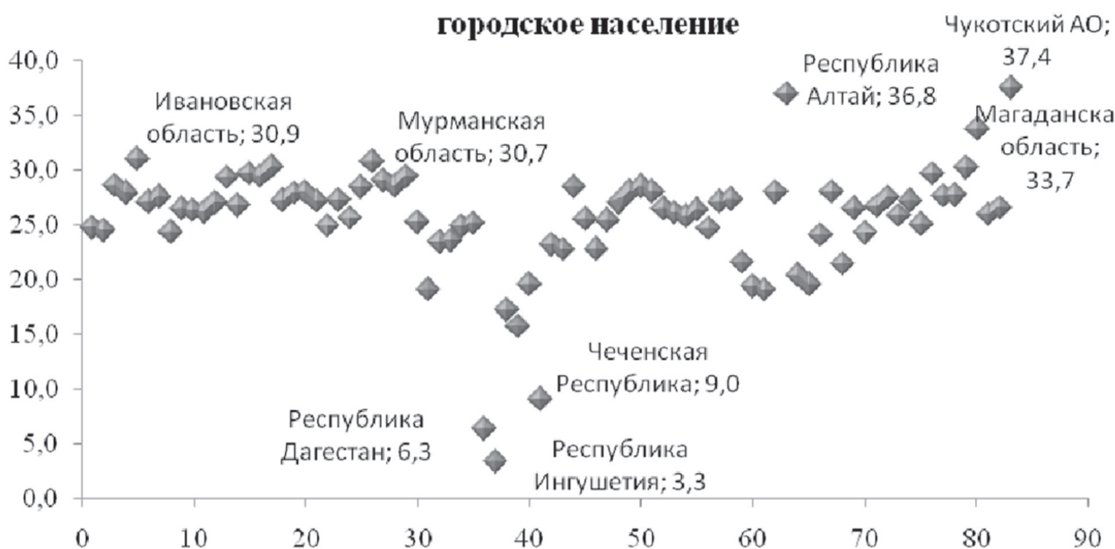
Рис. 2. Распределение субъектов РФ по доле одиноких частных домохозяйств (сост. по: Частные домохозяйства по размеру домохозяйств по субъектам РФ // Всероссийской переписи населения 2010 года. Т. 6. Число и состав домохозяйств. [Электронный ресурс]. URL: http://www.gks.ru/free_doc/new_site/perepis2010/croc/perepis_itogi1612.htm (дата обращения: 08.01.2015) )

(дисперсия признака) больше и достигает 35 % (табл. 1). Это объясняется более «северным» типом расположения частных сельских домохозяйств. Однако общая картина сегодня диктуется городской системой расселения.