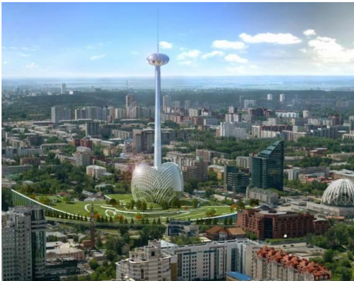
Рис. 1. Проект реконструкции Екатеринбургской телевизионной башни «Green Hill Park»

Победителем Международного творческого конкурса был признан архитектурный проект «Green Hill Park» рис. 1. Положительной чертой данного проекта стало удачное применение лучших практик современного городского урбанизма, позволившего найти разумный баланс социальной и коммерческой составляющих девелоперского проекта, посредством создания рекреационной зоны и коммерческих, пригодных для организации семейного досуга познавательного и развлекательного характера площадей объекта.