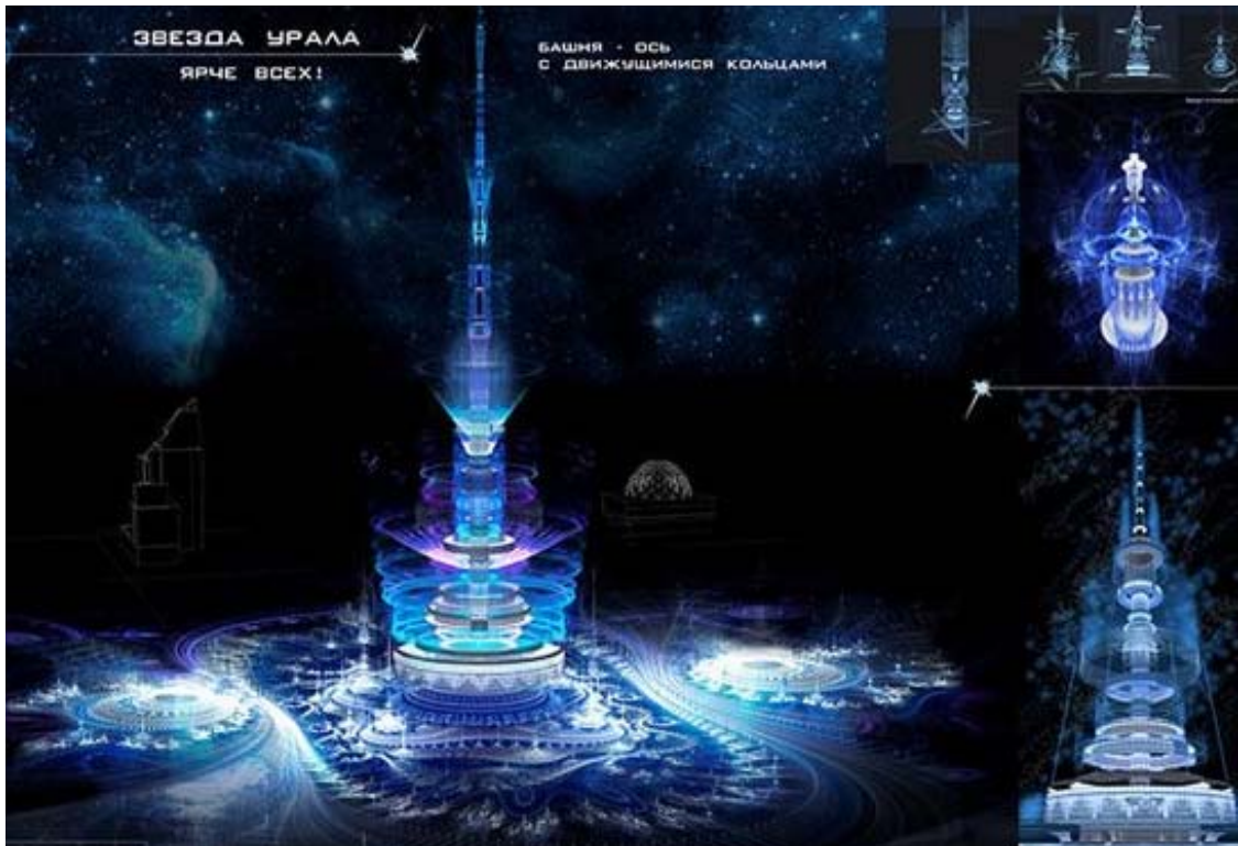
Рис. 2. Проект реконструкции Екатеринбургской телевизионной башни «Звезда Урала»

Awards. Цель данного конкурса – продвижение тем энергоэффективности и экологичности недвижимости. Авторы концепции Звезда Урала уверены, что реализация предложенной концепции обеспечит Свердловской области известность не только в сообществе других регионов России, продвигая «зеленые технологии», но и далеко за её пределами.