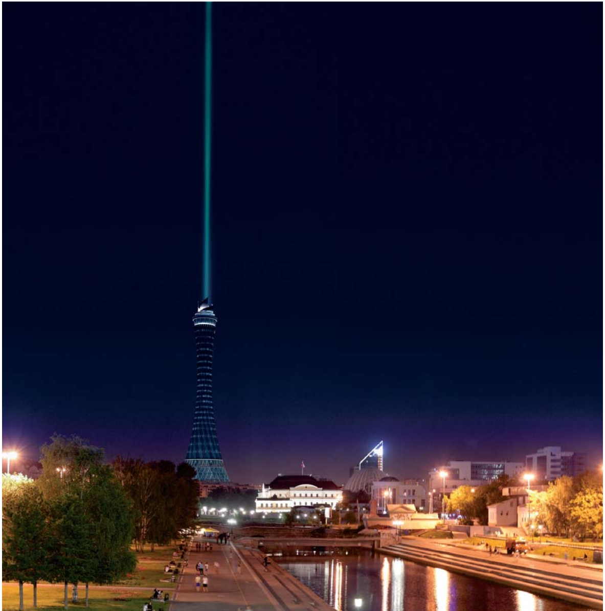
Рис. 4. Проект реконструкции Екатеринбургской телевизионной башни «Глобальный маяк»