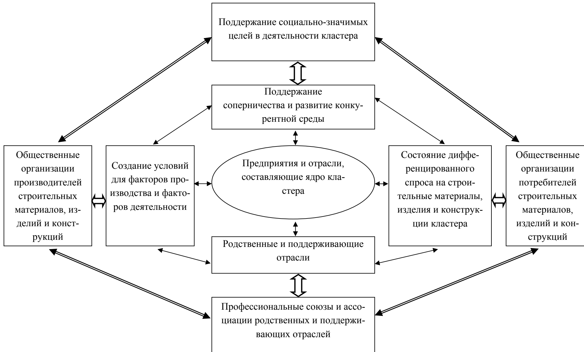
Рис. 2. Влияние правительства, бизнеса (внутренний ромб) и общественных организаций производителей и потребителей строительных материалов, изделий и конструкций (внешний ромб) на формирование и совершенствование кластеров стройиндустрии