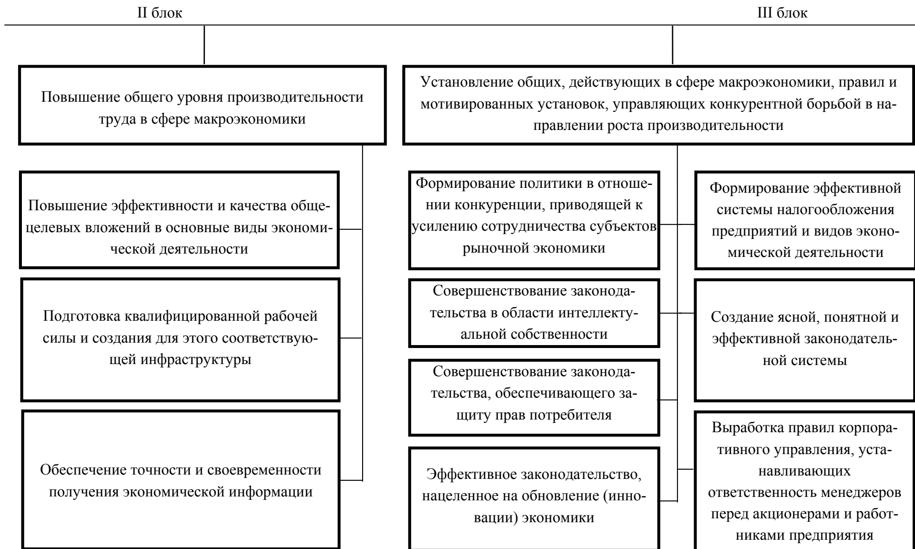
Рис. 1 б. Роль и функции властных структур в экономике региона, необходимые для поддержки и развития кластеров, блоки II и III