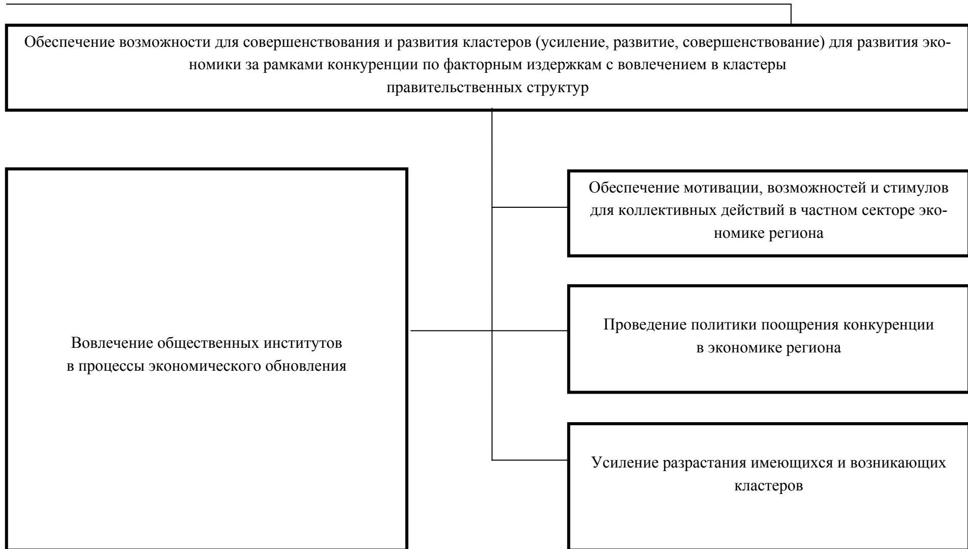
Рис. 1 в. Роль и функции властных структур в экономике региона, необходимые для поддержки и развития кластеров, блок IV