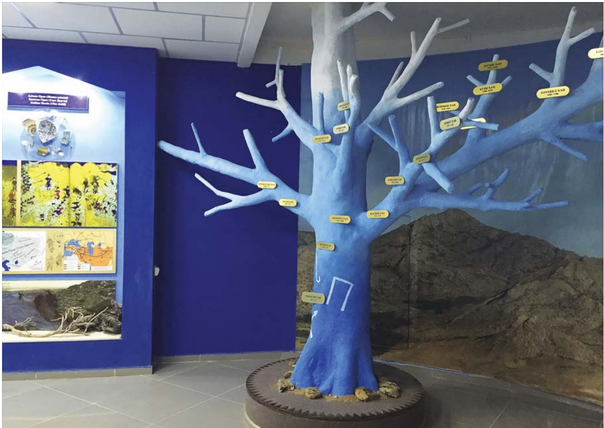
Фрагмент экспозиции: инсталляция «Ханское древо» Национальный историко-культурный и природный заповедник-музей «Улытау». 2015 г.