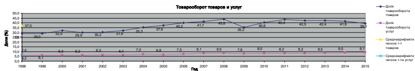
Рис. 1. Соотношение товаров и услуг в суммарном товарообороте стран АТЭС, (1998–2015)

3) Динамика изменения объема ПИИ в страны АТЭС и другие страны мира показывает, что страны АТЭС одинаково заинтересованы в экономическом сотрудничестве как друг с другом (952 587,6 млн долл.), так и со странами вне Форума (821 460,0 млн долл.) [3].