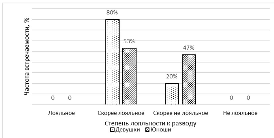
Рис. 3. Гендерные особенности лояльности к разводу в юношеском возрасте (частотный анализ, %)

33 % — скорее не лояльное. При этом, девушки проявляют больше толерантности в этом вопросе, чем юноши: 80 % против 53 (рис. 3).