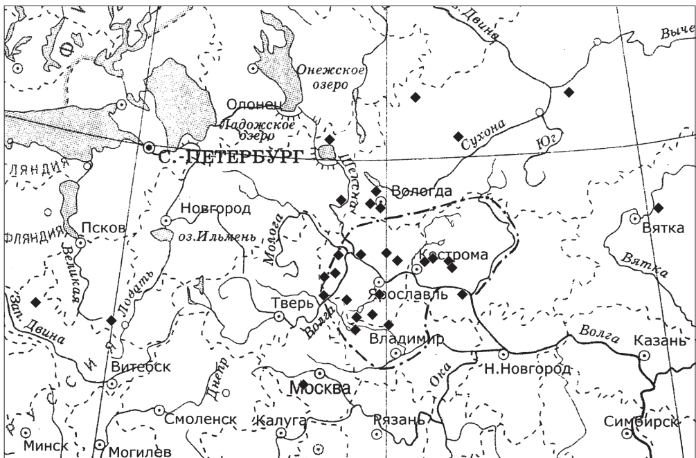
Карта 1. Топонимы с основой Маур- (сер. XIX в.)

На карте 1 представлено географическое распределение топонимов с основой Маур- .