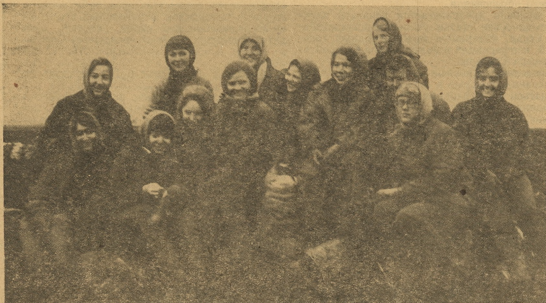
НЕУНЫВАЮЩАЯ БРИГАДА ФИЛОЛОГОВ.