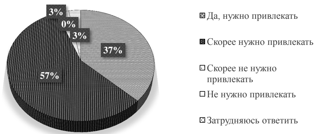
Рис. 1. Педагоги о важности привлечения работодателей для формирования целостного образа профессии

По данным опроса главным препятствием в повышении эффективности профориентационной работы является отсутствие сетевого взаимодействия между учреждениями системы общего образования, работодателями и органами власти. Такой вариант ответа выбрали 63 % респондентов. В характеристике эффективности методов профориентационной деятельности наивысшие оценки получили практико-ориентированные методы, такие как: привлечение работодателей-партнеров для организации летних практик, мастерских, технопарков (67 %); проведение профессиональных проб в различных организациях (52 %) и проведение экскурсий на предприятиях реальной сферы (74 %). Привлечение работодателей, по мнению педагогов, позволит обучающимся попробовать себя в понравившихся профессиях, познакомиться с носителями профессий, увидеть рабочее место, сформировать целостное представление о профессии (рис. 1).