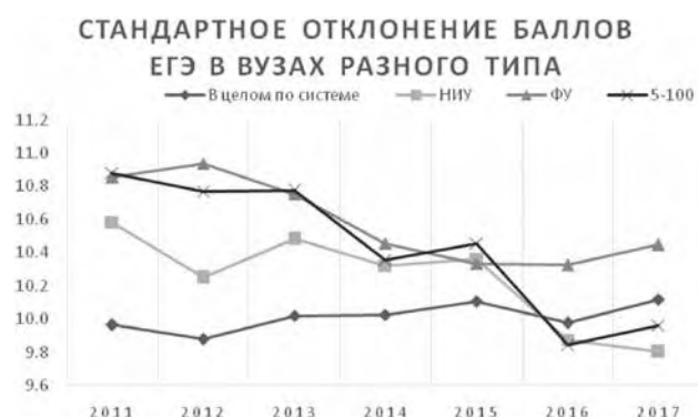
Рис. 2. Динамика изменения разброса баллов студентов внутри разных типов вузов, 2011–2017 (на основе данных Мониторинга качества приема)

Национальная политика в сфере высшего образования также является фактором, оказывающим воздействие на неоднородность студенческого контингента [1]. Она может задавать или отражать ожидания от высшего образования, и реагировать на глобальные тренды массовизации и интернационализации. Меры по стратификации, или вертикальной дифференциации, в частности, привели к сокращению академической неоднородности внутри ведущих российских вузов. Однако в целом академическая неоднородность студентов, поступивших в вузы на базе школьного образования, имеет тенденцию к росту (рис. 2).