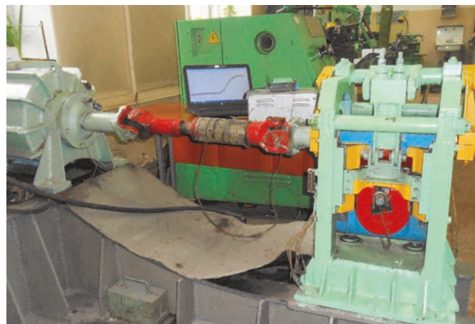
Рис. 1. Общий вид установки

Для проверки этих теоретических выводов спроектирована и изготовлена исследовательская установка, представляющая собой ножницы для резки полос с параллельными ножами (рис. 1), состоящая из рамы, электропривода с карданным валом, приводящим в движение в вертикальной плоскости через эксцентриковый