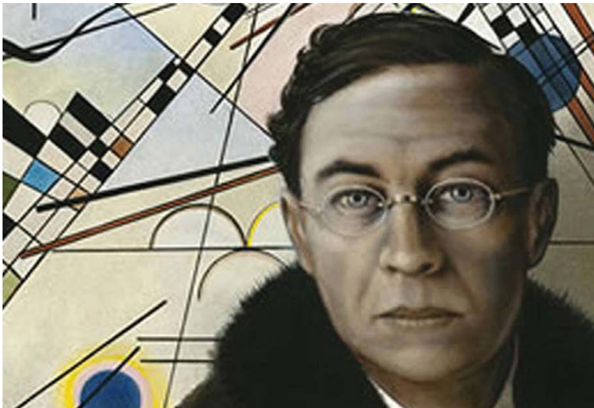
Василий Кандинский на фоне всемирно известной работы «Композиция VIII». 1923 г. (коллаж)