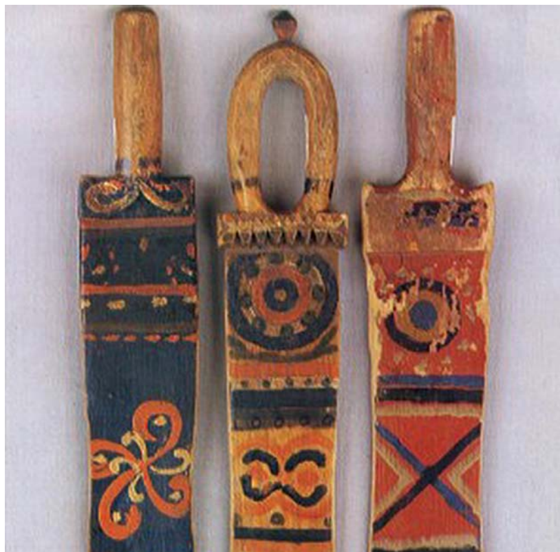
Трепала. Верхневыхегодская роспись, конец XIX — начало XX в.