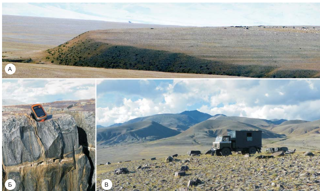
Рис. 2. Позднепалеолитический памятник Бигдон.

Таким образом, даже при многочисленности палеолитических памятников их использование для определения времени спуска ледниково-подпрудных озер с уровнями до 2 100 м (максимального хорошо выраженного в рельефе Курайской и Чуйской впадин волноприбойного уровня) невозможно вследствие подъемного характера каменного материала, залегающего ниже этой отметки, вероятного переотложения большинства находок и сложности их абсолютного датирования. Все четыре стратифицированных памятника Чуйской впадины расположены выше 2 100 м над ур. м., соответственно, они могут служить маркерами су-