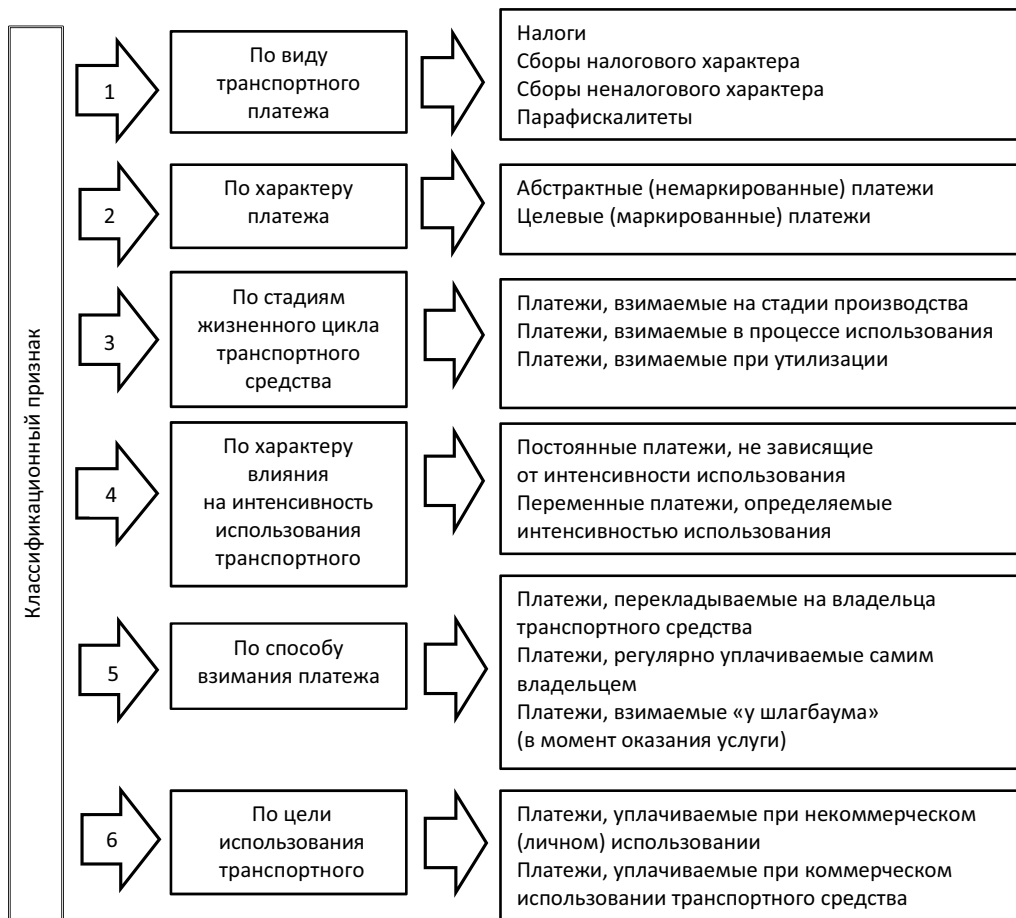
Рис. 2. Основные классификации транспортных платежей

Сущностное отличие сбора (пошлины) как налогового платежа и фискально-го сбора (пошлины) как неналогового платежа состоит в различном соотношении со стоимостью оказываемой государством услуги (предоставления прав). Общее правило таково, что фискальный сбор имеет компенсационный характер , т.е. он компенсирует величину стоимостной оценки предмета сбора (например, платежи за негативное воздействие на окружающую среду покрывают затраты, связанные с ущербом от выброса в атмосферу вредных веществ) или расходы государства по оказанию услуги (например, затраты государства по изготовлению и выдаче государственных номерных знаков). Следовательно, величина фискального сбора должна соответствовать размеру получаемой плательщиком специальной выгоды либо равняться себестоимости оказываемой плательщику услуги.