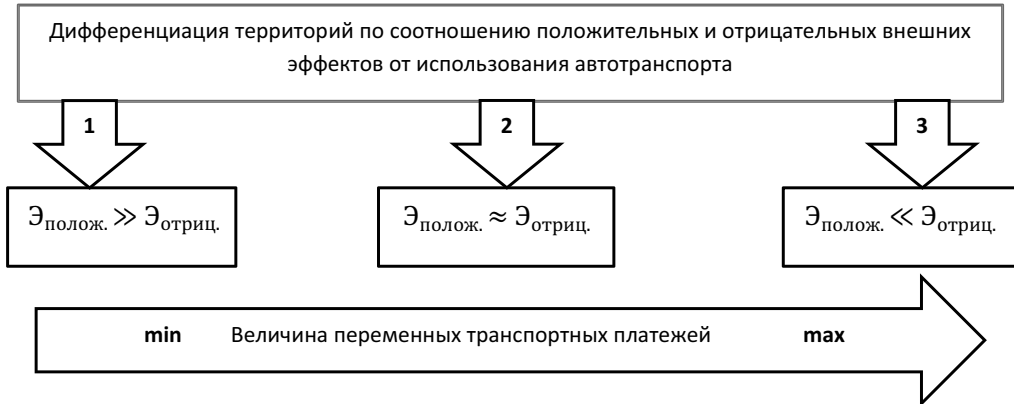
Рис. 4. Дифференциация территорий и размера переменных транспортных платежей по соотношению положительных и отрицательных эффектов от использования автотранспорта

Особенно важна территориальная дифференциация переменных транспортных платежей. Выделим три принципиально различающихся ситуации, которые могут быть на разных территориях страны. Эти ситуации имеют разное соотношение положительных и отрицательных внешних эффектов и, соответственно, должны определять разные условия для транспортного обложения, развития дорожной сети и регулирования уровня автомобилизации (рис. 4).