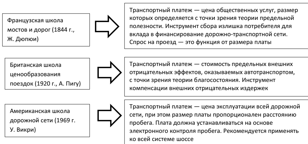
Рис. 1. Основные научные школы по обоснованию транспортных платежей

Первые теоретические исследования вопросов обложения транспорта, и прежде всего определения их размера, датируются серединой XIX в. Виды дорожной платы, носившие в основном хаотичный и необоснованный характер, с одной стороны, резко критиковались как помеха торговле. С другой стороны, экономисты обосновывали необходимость наличия хорошо организованной и развитой сети дорог, обеспечивающей стратегические и экономические преимущества, в том числе и для более активного развития торговли. Генезис теоретических обоснований транспортных платежей представлен на рис. 1.