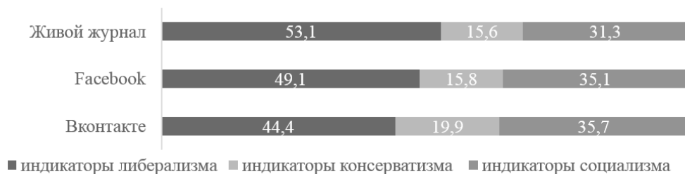
Рисунок 1. Идеологии, актуализированные в сообществах социальных сетей (в % от общего числа слов-индикаторов)

Расхождение в риторике имеет своим следствием и некоторые различия в идеологических картинах, которые ею задаются (см. рис. 1, 2).