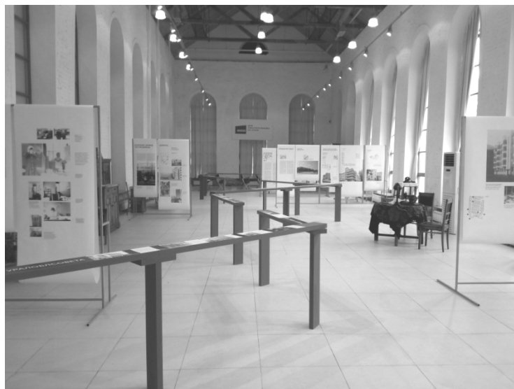
Рис. 2. Выставка «Городки Свердловска»: от архитектурного проекта к социальному опыту». Музей архитектуры и дизайна г. Екатеринбург.