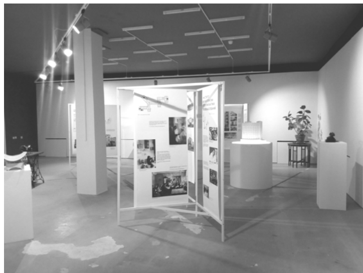
Рис. 3. Выставка «Городки Свердловска: от архитектурного проекта к социальному опыту». Центр авангарда, г. Москва