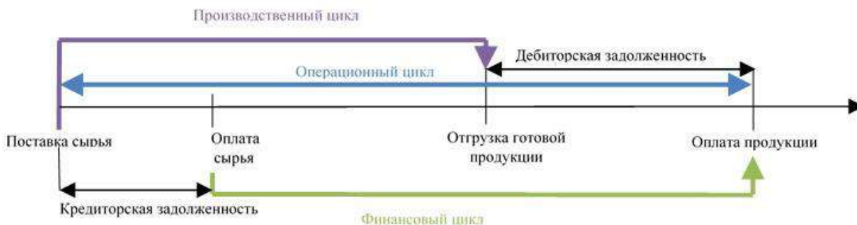
Рисунок 2 – Оборачиваемость оборотных средств предприятия 45

Общая сумма оборотных средств предприятия оборачивается в течение операционного цикла. Частью операционного цикла является финансовый цикл, в котором участвуют только собственные оборотные средства. Каждое предприятие проходит через цикл операционной деятельности. В этот период осуществляется закупка материально-производственных запасов, происходит процесс производства готовой продукции, которая в последствии реализуется за наличные денежные средства или в кредит, далее осуществляется погашение дебиторской задолженности за счет поступления денежных средств от покупателей. На рисунке 2 мы можем увидеть структуру операционного, производственного и финансового циклов.