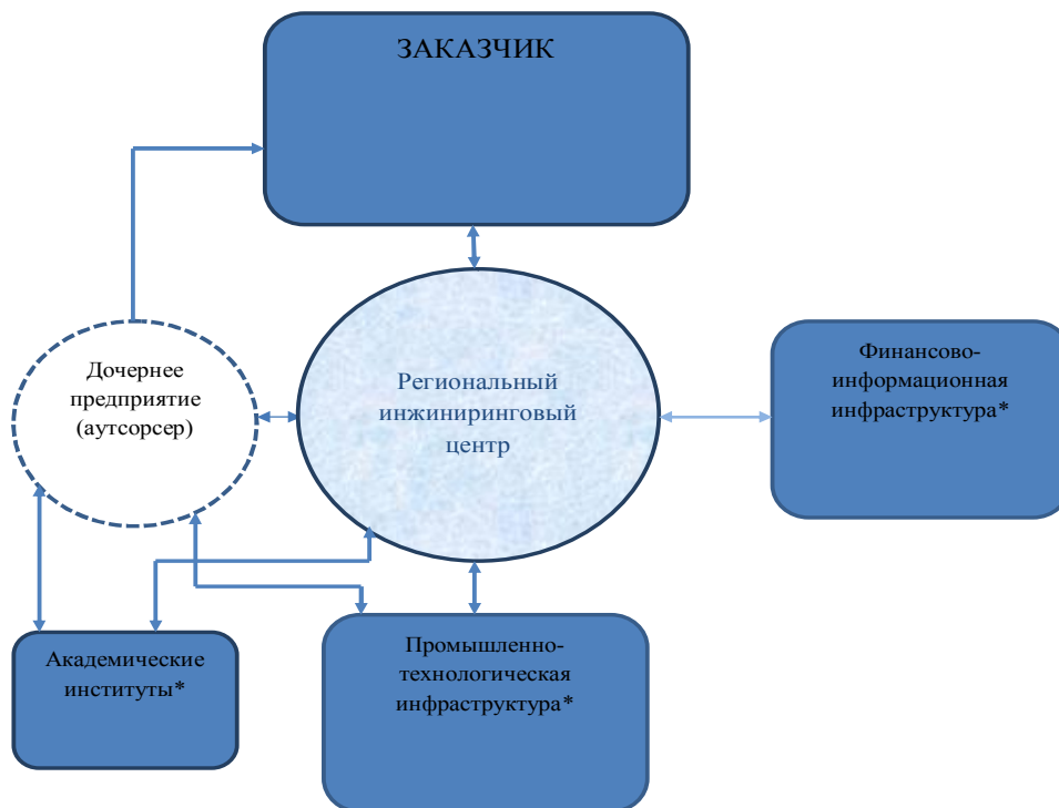
Рис. 3. Интеграционный механизм взаимодействия: * – возможно использование в работе объединения объектов. Например, для финансово-информационной инфраструктуры это может быть консорциум банков; для академических институтов – группа академических институтов для выполнения НИР в смежных отраслях (составлено авторами)

ЕРС-контракта (от англ. engineering – проектирование, procurement – поставка материалов и оборудования, construction – строительные, сборочные и пусконаладочные работы), применяемого в различных отраслях народного хозяйства. Основная идея, используемая в процессе реализации ЕРС-контракта, заключается в том, что ответственность за реализацию всего объема работ, начиная от стадии проектирования и заканчивая доведением инновационной разработки до этапа внедрения в производство у заказчика, несет ЕРС-контрактор – организация, с которой промышленное