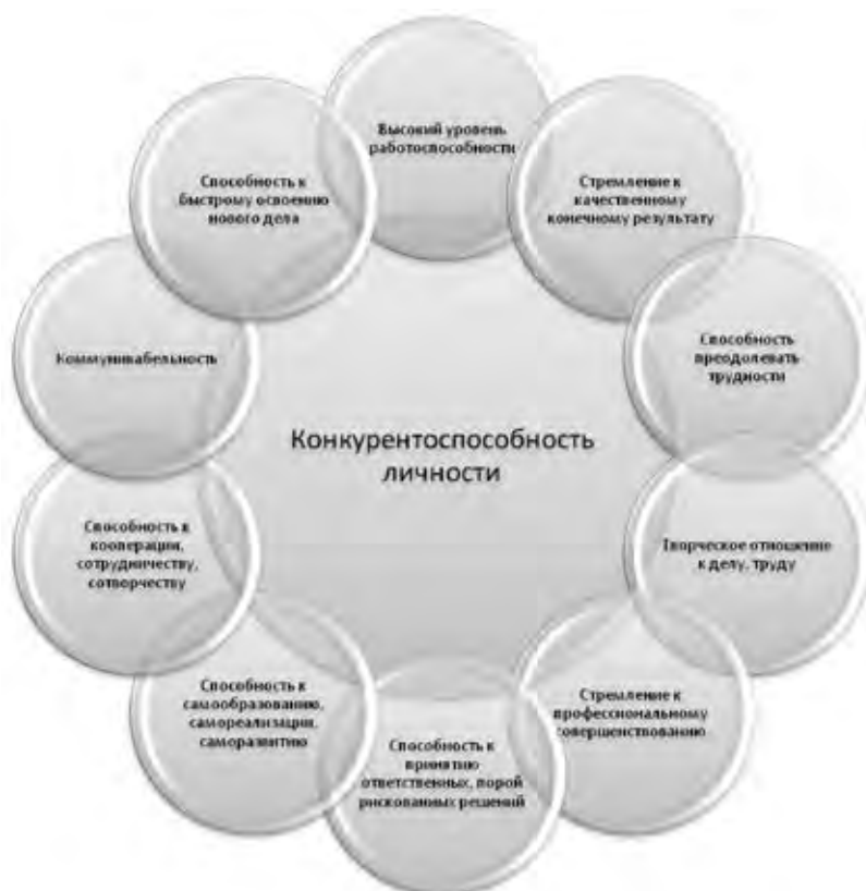
Рис. 1. Свойства и особенности конкурентоспособной личности [8]

интегральное качество личности, представляющее собой совокупность ключевых компетенций и ценностных ориентаций, позволяющих данной личности успешно функционировать в социуме [10]. Ю. В. Соловьева определяет конкурентоспособность личности студента как интегративное личностное качество, которое характеризуется сформированностью мотивов успеха, достижения и выбора [11].