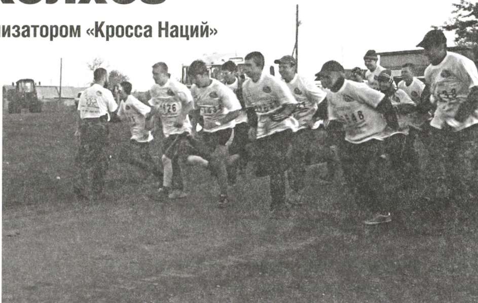
Первокурсники, бойцы уборочного отряда, полны решимости дойти до финиша и вернуться домой с победой.

«Кросс Наций» стал хорошей практикой для студентов нового факультета