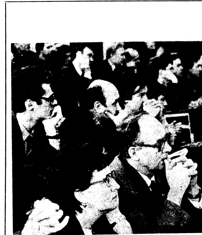
На прошлой неделе состоялась встреча с академиком АН СССР, Героем Социалистического Труда, лауреатом Государственной, Ленинской и Нобелевской премий Александром Михайловичем Прохоровым. В своем выступлении академик Прохоров рассказал о перспективах развития лазерной техники, ответил на вопросы слушателей.

логами? — Если говорить об исследованиях, конструкторских разработках, то лучше, чем у фирм Италии, ФРГ, Финляндии, имеющих опыт работы в этом