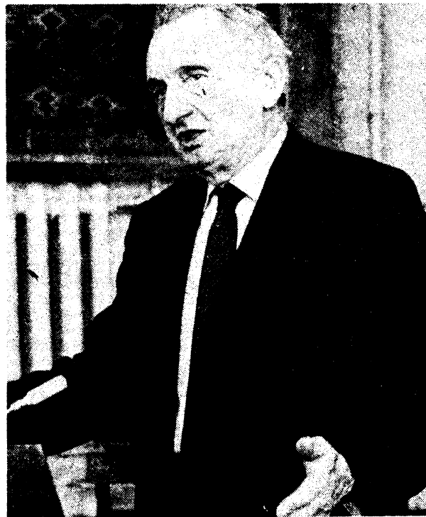
Ректор института профессор С. С. Набойченко вручил почетному гостю памятные медали УПИ и физико-технического факультета, а также авторское свидетельство на изобретение, сделанное вместе с сотрудниками кафедры экспериментальной физики.

направлении. Если о технологии, то у нас пока похуже.