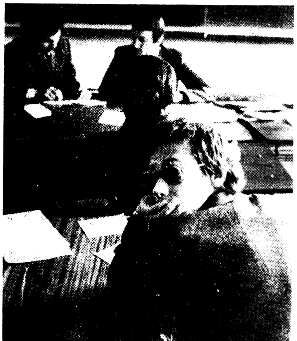
◆ Трудная ситуация.