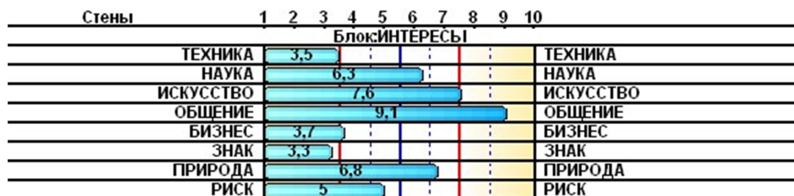
Рисунок 1. Пример данных по блоку интересы, норма от 3,5 до 7,5.

«Профиль способностей и интересов – это модель склонностей человека, которую важно рассматривать как целостную совокупность психических свойств человека. “Идеальные” (успешные и довольные) представители различных профессий характеризуются различными профилями – сочетаниями значений по шкалам теста (это определяется спецификой выполняемой деятельности)» [70, 80, 82, 83] (рис. 1).