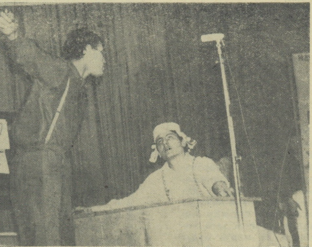
На снимках А. Устюгова: домашние задания физтехов, химиков.