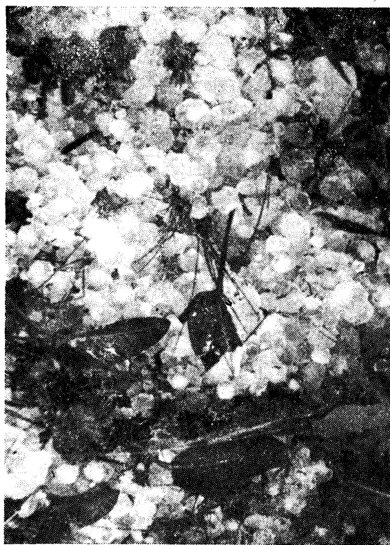
ГРАД.