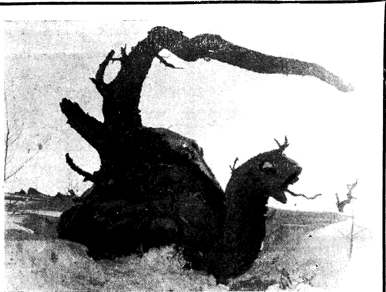
Лесная скульптура.