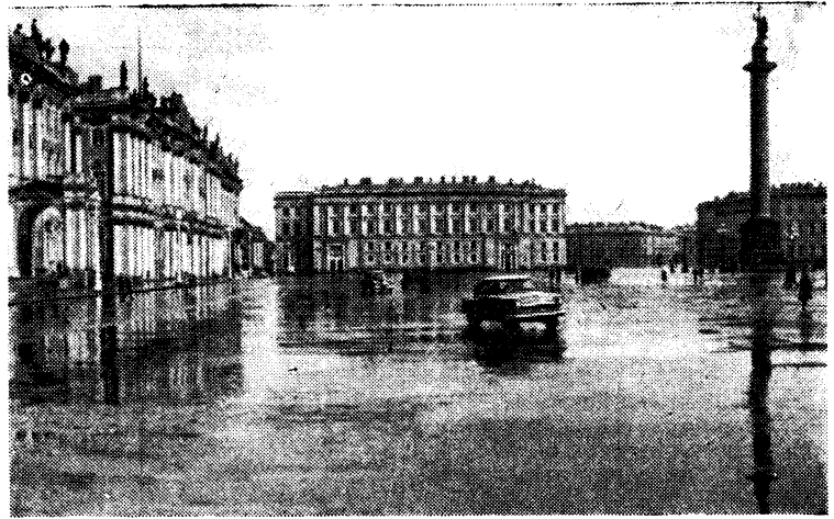
Дворцовая площадь. 19 июля 1920 года В. И. Ленин выступил здесь на митинге с речью. Это был последний приезд В. И. Ленина в Петроград.