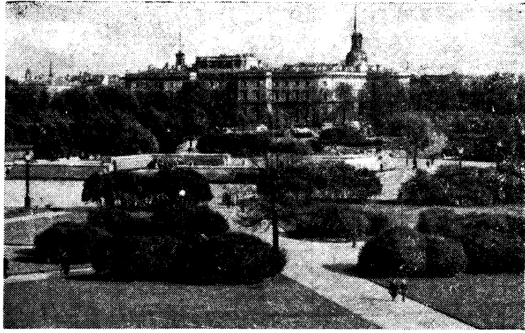
Марсово поле. В. И. Ленин выступил с речью на первомайском митинге в 1917 году. 18 июня того же года он участвовал здесь в антиимпериалистической демонстрации. 19 июля 1920 года вместе с делегатами II конгресса Коминтерна В. И. Ленин возложил венки на могилы борцов революции.