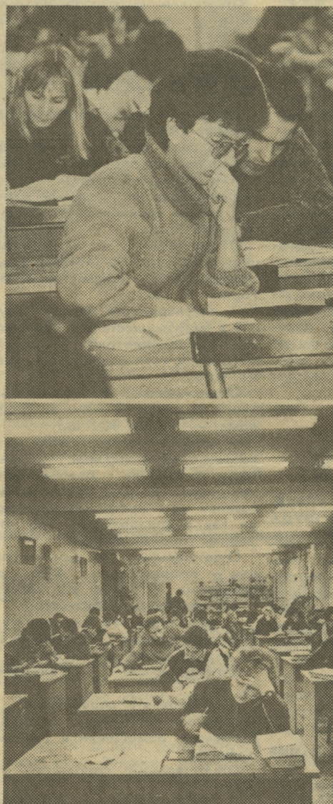
На снимках: в читальном зале библиотеки.

Научная библиотека УрГУ — одна из крупнейших и старейших на Урале. Книжный фонд ее составляет 1 миллион 200 тысяч томов и ежегодно фонд пополняют 50 тысяч книг. Ежедневно ее посещают 1,5 тысячи человек. Это все факты парадной стороны медали. Но, к сожалению, есть и изнанка.