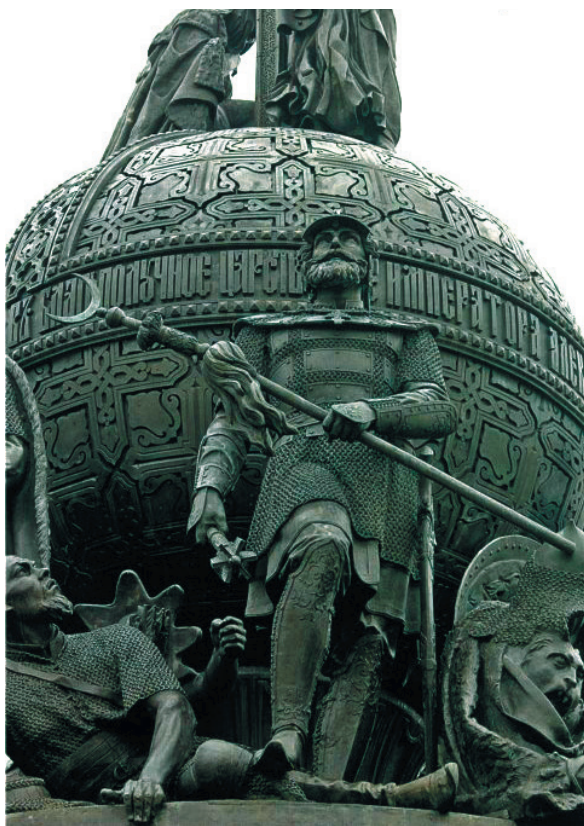
Памятник 1000-летию России. Великий Новгород. 1862. Дмитрий Донской в группе «Начало освобождения Руси от татарского ига» Monument to the 1000th anniversary of Russia. Veliky Novgorod. 1862. Dmitry Donskoy in the group "The Beginning of the Liberation of Rus from the Tatar Yoke"