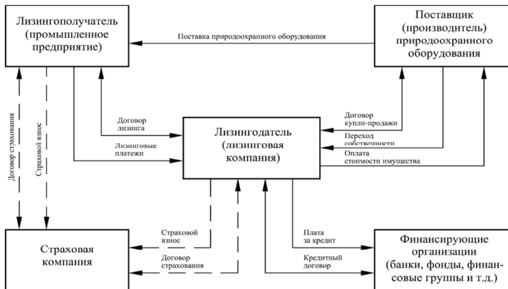
Рис. 1. Общая схема лизинговой сделки и финансовых потоков

Лизингополучатель самостоятельно подбирает себе необходимое имущество и подаёт заявку в лизинговую компанию, в которой указывается – какое именно имущество необходимо приобрести и иногда у какого поставщика это можно сделать. После получения заявки лизингодатель рассматривает её и выносит заключение о платёжеспособности лизингополучателя и эффективности проведения лизингового процесса. Кроме этого, оценивается спрос на передаваемое по лизингу имущество (его ликвидность), чтобы в случае досрочного расторжения договора лизинга была большая вероятность его вторичной сдачи. На основе принятого решения заключается договор купли-продажи между компанией-поставщиком и лизингодателем, а также