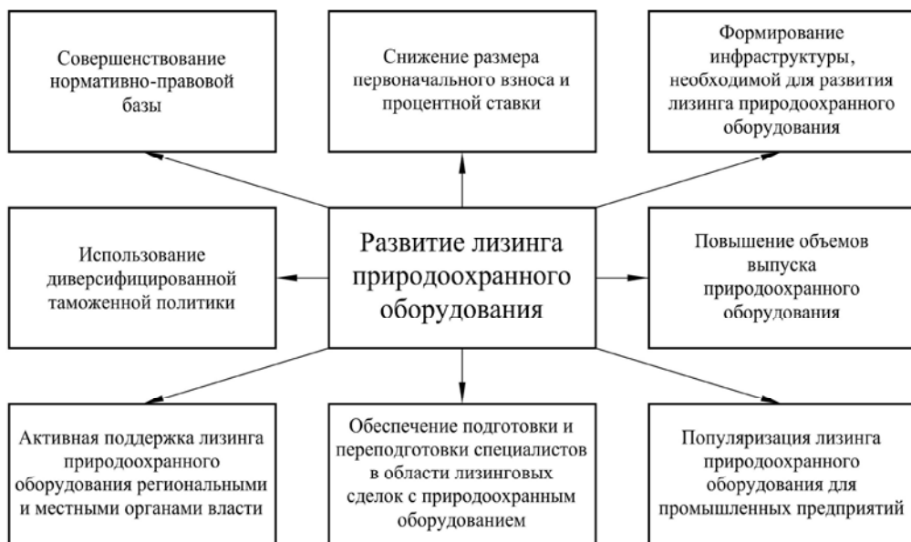
Рис. 3. Направления повышения инвестиционной привлекательности лизинга природоохранного оборудования

Популяризация лизинга природоохранного оборудования для промышленных предприятий заключается в формировании позитивного отношения у собственни-