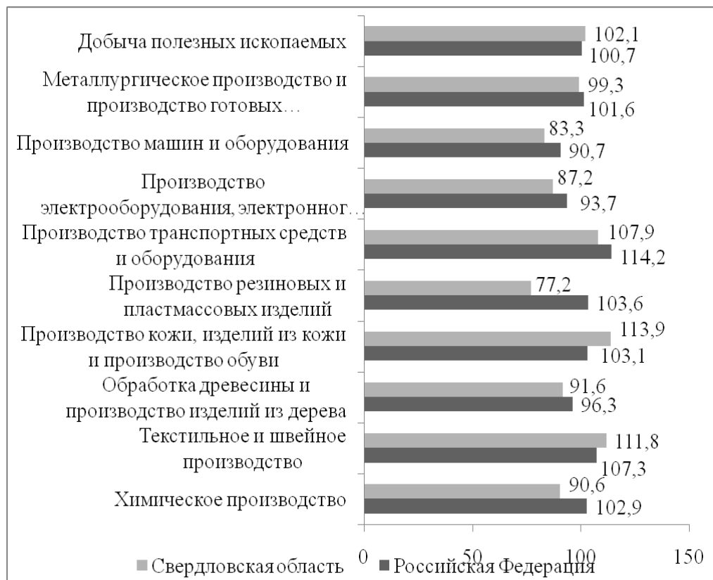
Рис. 1. Индексы промышленного производства по курируемым видам экономической деятельности за январь-июнь 2014 г. к январю-июню 2013 г.