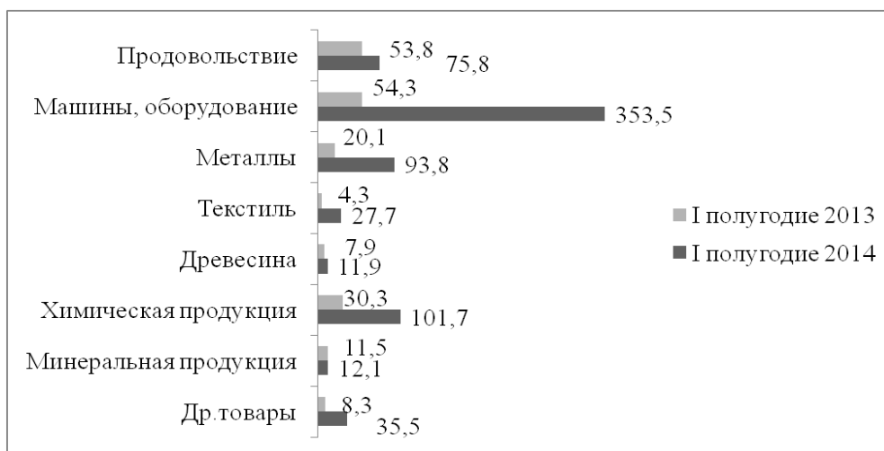
Рис. 4. Товарная структура импорта (страны ближнего зарубежья) в январе-июне 2014 г., млн долл. США

В январе-июне 2014 г. предприятия и организации Свердловской области поддер-