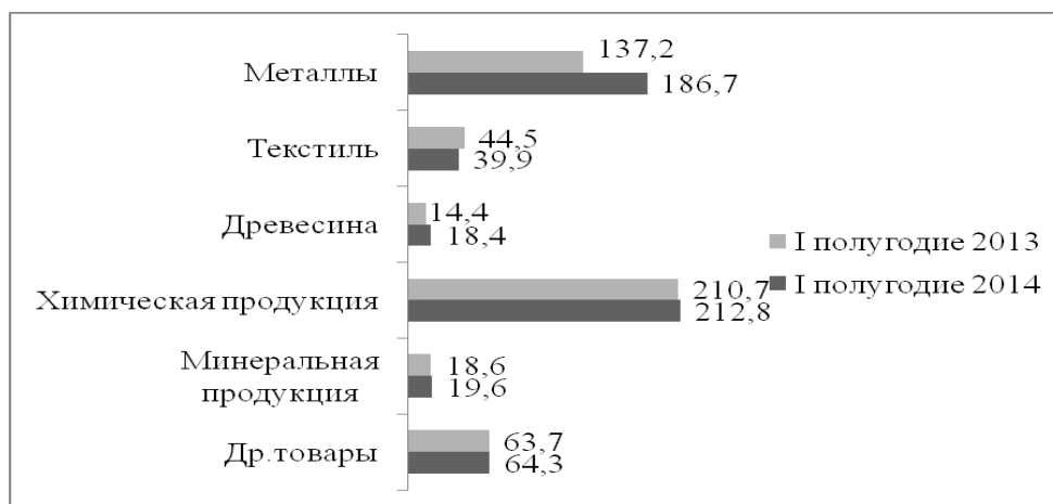
Рис. 5. Товарная структура импорта (страны дальнего зарубежья) в январе-июне 2014 г., млн долл. США