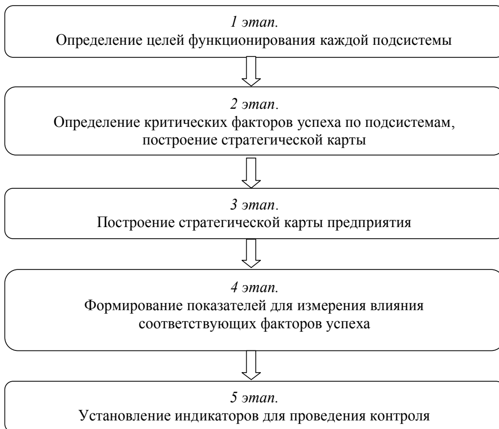
Рис. 2. Этапы формирования сбалансированной системы показателей

центральное место отводится подготовке стратегической карты предприятия, на которой в сжатой форме представлены факторы, способствующие достижению целей предприятия, и указаны связи между ними. Разработка стратегической карты является одним из важнейших этапов построения сбалансированной системы показателей (ССП) [4]. Она основана на формировании целей и показателей в зависимости от стратегии предприятия по 4 перспективам, включая финансы, взаимоотношения с клиентами, внутренние бизнес-процессы, а также обучение и развитие персонала (рис. 2).