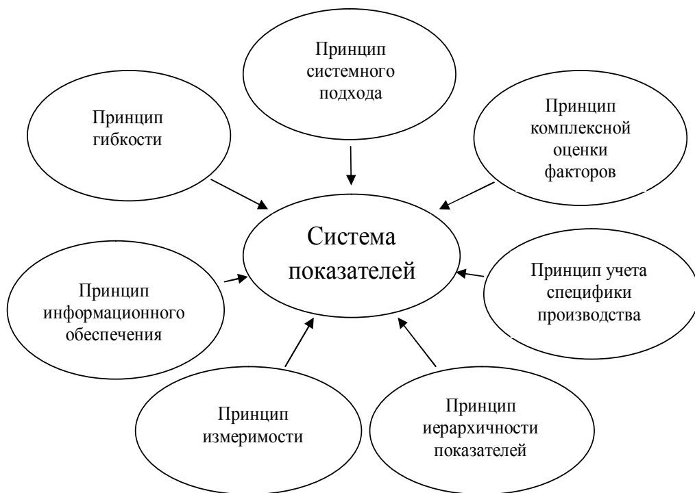
Рис. 1. Принципы проведения оценки влияния энергетического фактора на результаты деятельности предприятия

В-шестых, принцип достоверности информационного обеспечения, предполагающий, что все показатели, исполь-