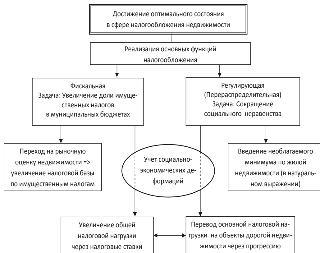
Рис.1. Модель достижения оптимума в сфере налогообложения недвижимости

Регулирующая функция налогов, в основе которой лежит понимание неизбежности влияния налогов на экономические процессы, рассматривается в данной модели с точки зрения своих перераспределительных возможностей. Необходимость их использования в имущественных налогах обуславливается проблемой избыточного расслоения в обществе. По темпу роста дифференциации населения Россия обгоняет даже страны Восточной Европы с переходной экономикой, и на данный момент уровень неравенства в России выше, чем во всех странах Евросоюза и странах – членах ОЭСР, и сопоставим с показателями Турции и Мексики [7].