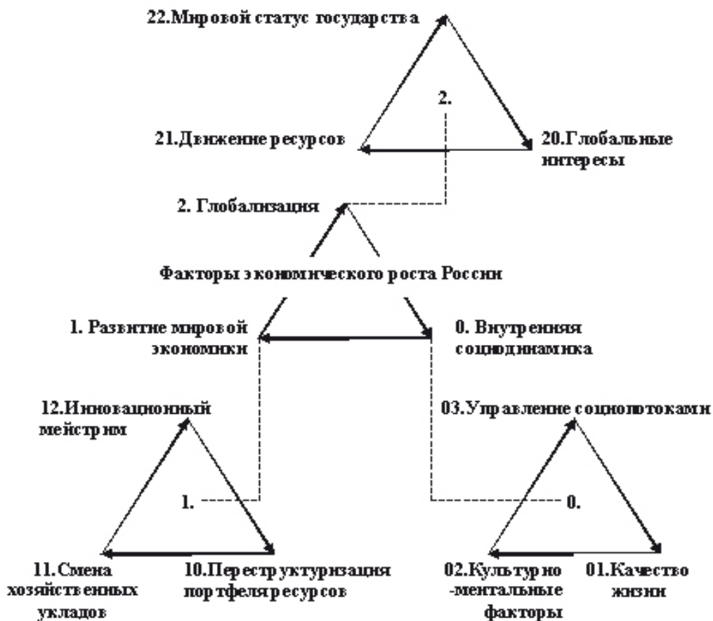
Рис. 1. Система понятий, используемых в исследовании факторов социально-экономического роста России

Учитывая все три указанные группы процессов, сконцентрируем внимание на первой – проблемах социодинамики. Существенной внутренней проблемой России из этого ряда является