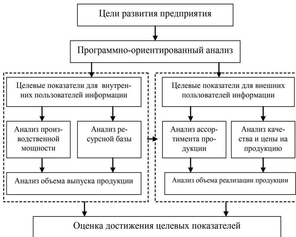
Рис. Схема проведения программно-ориентированного анализа

Ряд экономистов дополняют общую методику рассмотрением дополнитель-