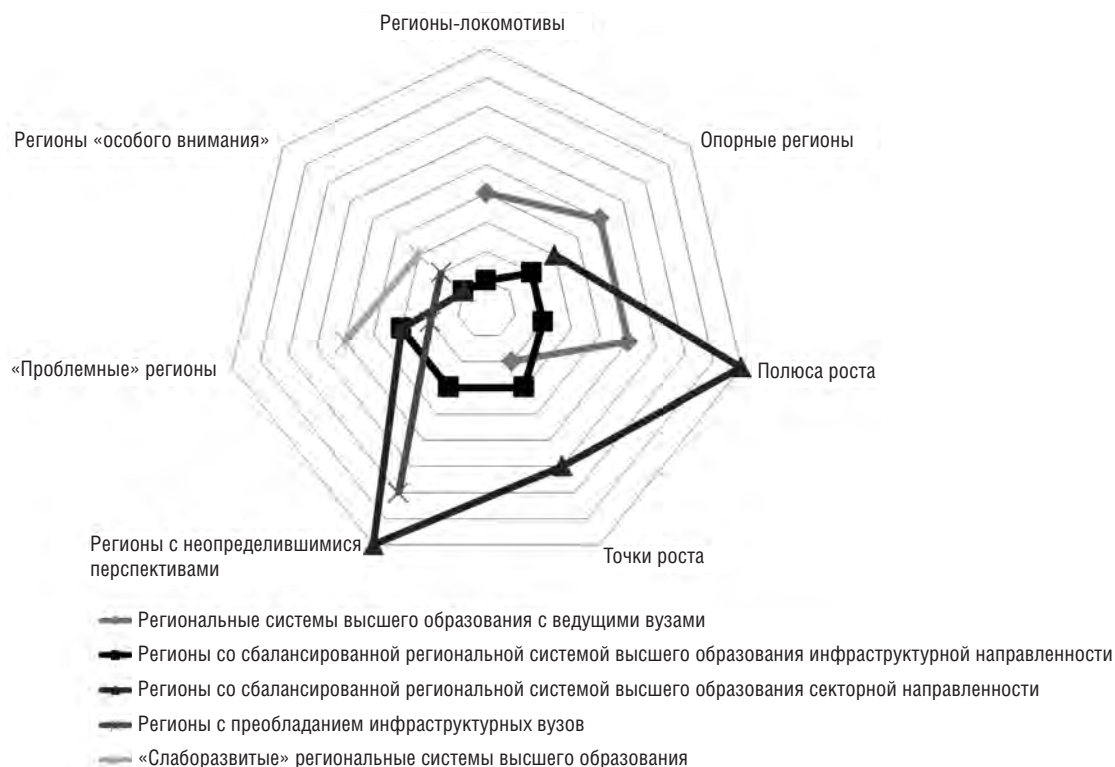
Рис. 2. Соотношение типологии региональных систем высшего образования и типологии социально-экономического состояния регионов

инвестиционной привлекательности (регионы-локомотивы, опорные регионы, полюса роста, точки роста).