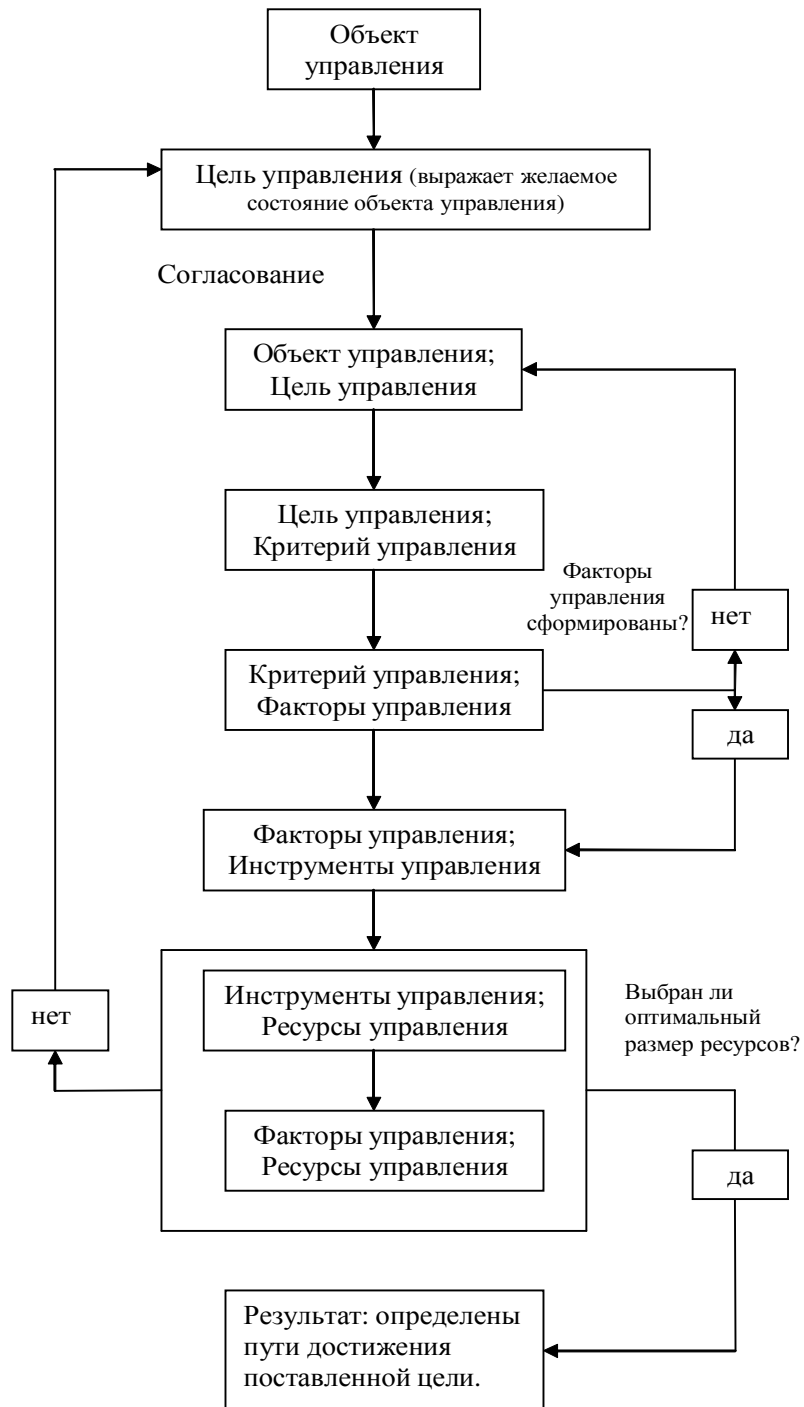
Рис. 1. Алгоритм формирования механизма управления предприятием