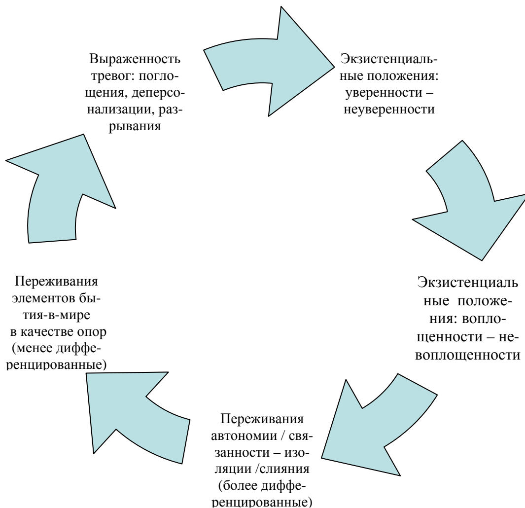
Рис 1. Взаимосвязь понятий, характеризующих континуум «онтологическая уверенность – неуверенность»

нию, непереносимыми становятся как личностные, так и широко представленные в повседневной жизни формальные отношения, при которых один человек является не более чем объектом в глазах другого. Тревоги поглощения, деперсонализации и разрывания выступают как следствие ощущения дефицита автономии, которая может быть утрачена любым из трех способов. К этим угрозам причастны также дефектные отношения с миром и людьми. Таким образом, табл. 1 может быть дополнена рис. 1, в соответствии с которым описание онтологической уверенности – неуверенности можно начать с любого из звеньев, изображенных на циклической диаграмме.