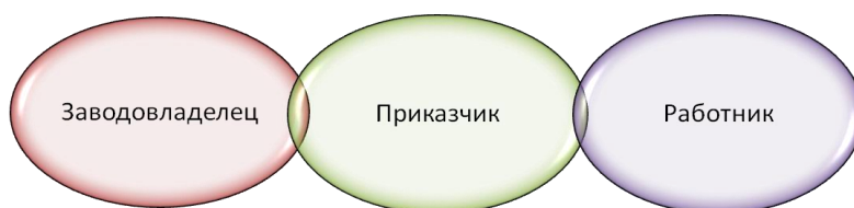
Рис. 1. Схема патронатных отношений заводладельцев и работников на заводах Южного Урала во второй половине XVIII в. 18

Кем по социальному статусу являются основные заводские кадры? Разумеется, это крепостные. Именно из их числа формируется штат плотников, мастеров, подмастерьев. Вольнонаемные работники выполняют в основном подсобную работу. Наконец, из крепостных формируется и приказчий корпус. Конечно, это должны были быть работники, которым заводчик мог всецело доверять (особенно, если он сам длительное время не жил на заводе). Поэтому не только экономический мотив, но и фактор личного доверия, личного отношения между заводчиком и работником играл весьма значимую роль в процессе комплектования рабочих кадров на заводах. Данное обстоятельство подтверждается документально. Так, Ларион Лугинин 17 августа 1781 г. выписывает доверенность на имя своего приказчика Акима Чукносова на получение купчей на землю, купленную в Карытабынской и Барытабынской волостях у башкир 17 . Поэтому утверждать, что крепостные работники составляли наиболее бесправную категорию заводских кадров, не совсем верно. Здесь мы можем выстроить определенную цепочку отношений (рис. 1).