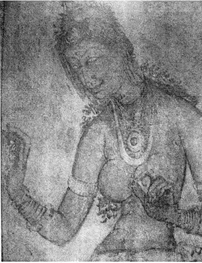
Роспись. Сигирия. V в.