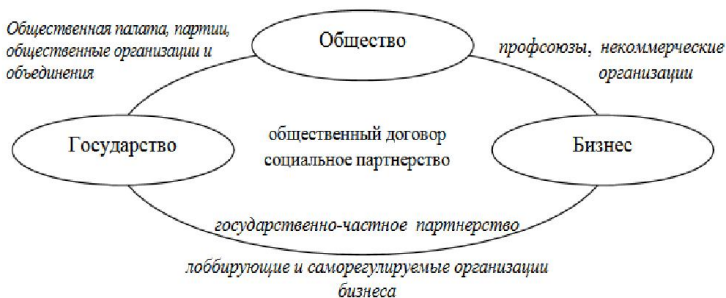
Рис. 1. Институты взаимодействия государства, общества и бизнеса [1]

Научное сообщество достаточно активно исследует проблемы взаимодействия органов власти и бизнес-структур, такие исследования не теряют свою актуальность в связи с постоянными процессами реформирования, наличия экономических кризисов или иных социальных явлений. В это связи лишь подчеркнем, что плеяда классических и современных социологов и политологов находили особенности в раскрытии тенденций и закономерностей функционирования отношений «власть и бизнес», и через понимание предпринимательства, корпораций и их влияния на политику, и через профсоюзные организации и через конфликты системы. Назовем некоторых, а именно: М. Вебер, В. Зомбарт, К. Маркс, И. Шумпетер, Э. Гидденс. Существует и пласт российских исследователей столь сложной проблематики, а именно: А.В. Понеделков, Т.И. Заславская, В.В. Радаев, Ж.Т. Тощенко, прикладные социологические исследования под руководством М.К. Горшкова, В.В., Р.М. Нуреев, О. Салманова, В.И. Иноземцев.