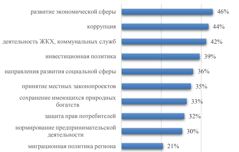
Рис. 4. Проблемы региона, в решении которых представители делового сообщества готовы принять участие

в которых местные бизнес-структуры готовы принять участие. Обнаружилось, что наиболее активно бизнес сообщество готово принять участие в нескольких направлениях деятельности: первое – то, что связано с развитием экономической сферы, инвестиционной политикой, нормированием предпринимательской деятельности – то, что позволит учесть экономические интересы сторон. Второе – это вопросы политического характера: принятие местных законопроектов, защита прав потребителей, миграционная политика региона. Третье – это социальная сфера: направления развития социальной сферы, сохранение имеющихся природных богатств. В целом наибольшую популярность получили два аспекта деятельности – развитие экономической сферы и борьба с коррупцией.