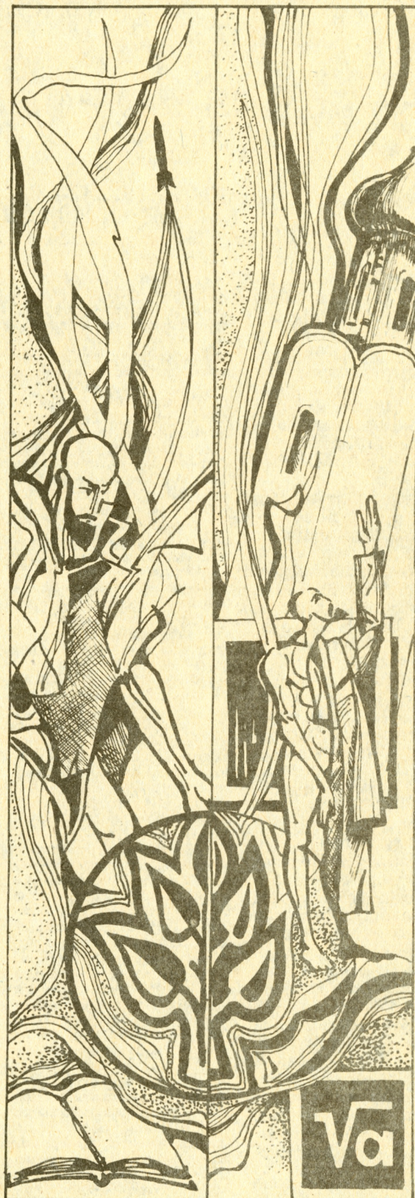
Рисунок С.Жукова Окончание на стр. 10

Кого же мы относим к интеллигенции? Очевидно, далеко не всех специалистов. Специалисты - социальная группа общества; это люди, занятые профессиональным умственным трудом, т.е. группа, сложившаяся на основе объективных формальных признаков. Иное дело интеллигенция - это оценочная категория, характеризующая качественные особенности личности, определенный тип мышления и поведения.