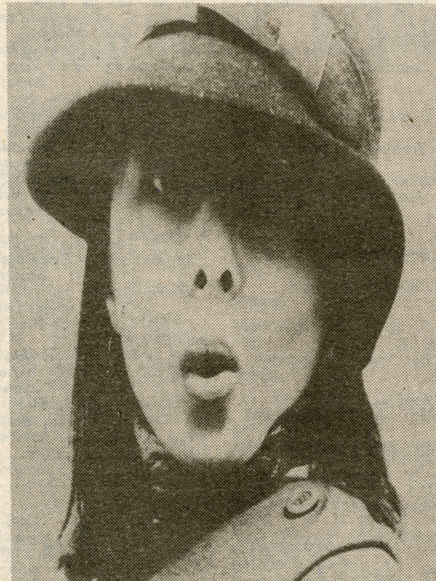
Л. БУТНАРИ. «МАДМУАЗЕЛЬ ФИФИ»

6. Что для 80 процентов студенток основной источник доходов — стипендия; для 13 процентов — стипендия плюс денежные переводы любимых родителей; для 6,9 процента стипендия плюс деньги родителей, плюс приработок. А две студентки с физического факультета — миллионерши. (Адреса последних редакция не высылает).