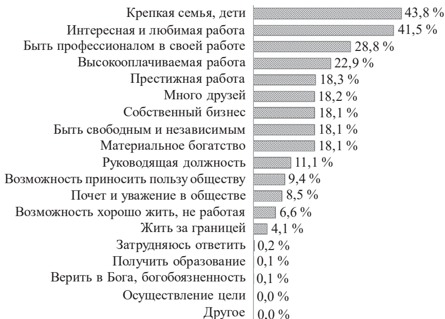
Рис. 1. Распределение ответов на вопрос: «Что значит для Вас жизненный успех?» (% от опрошенных)

Данные исследования показывают, что труд является для молодых казахстанцев не только терминальной ценностью (целью, к которой необходимо стремиться), но и инструментальной ценностью – средством достижения основных жизненных целей. Так, по результатам исследования 53,6 % считают, что добиться успеха можно, лишь постоянно и упорно работая.