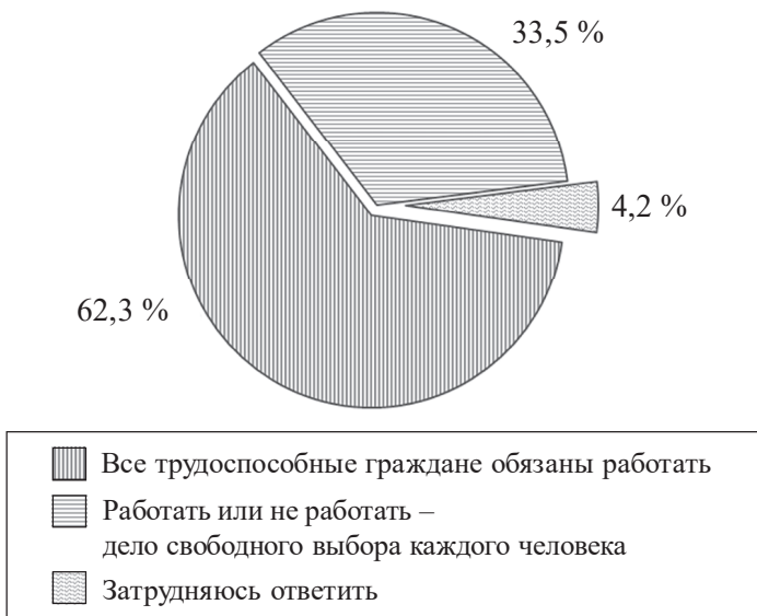
Рис. 3. Распределение ответов на вопрос: «Считаете ли Вы, что все трудоспособные граждане обязаны работать?» (% от опрошенных)