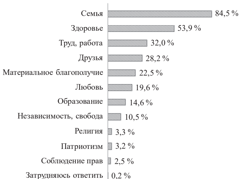
Рис. 2. Распределение ответов на вопрос: «Что из перечисленного для Вас является наиболее важным?» (% от опрошенных)

(33 % – мужчины, 31 % – женщины). На первом месте располагается ценность семьи (82,4 % – мужчины, 86,6 % – женщины), на втором – здоровья (50,6 % – мужчины, 57,2 % – женщины) (рис. 2).