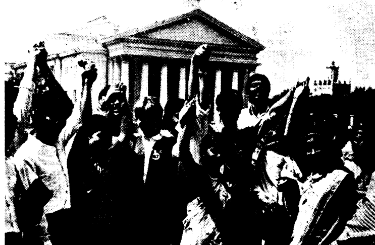
МИР, ДРУЖБА, МОЛОДОСТЬ, СЧАСТЬЕ!