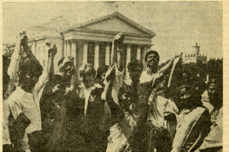
МИР, ДРУЖБА, МОЛОДОСТЬ, СЧАСТЬЕ!