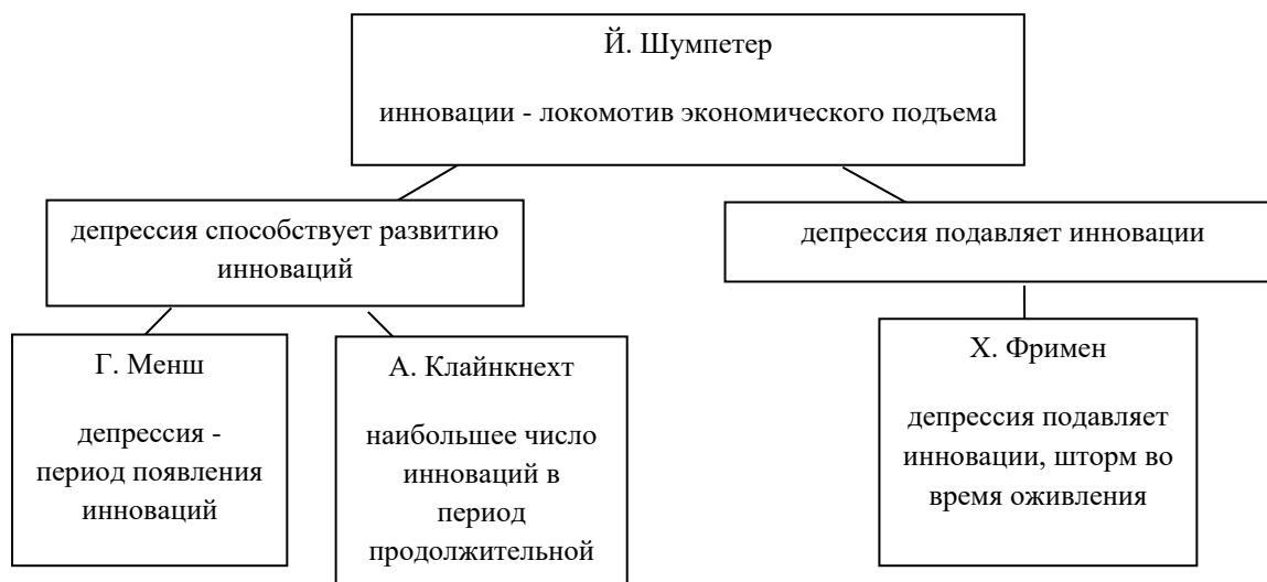
Рисунок 1. Развитие теории цикличности инновационных подъемов

Использование инновационных механизмов развития рассматривались относительно преодоления экономических кризисов, которые могут способствовать рождению инноваций (Г.Менш и А.Клайнкнехт) или становится причиной затормаживания их внедрения (Х.Фримен) [4] (рис.1).