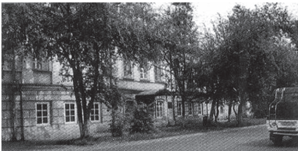
Рис. 2. Институт геохимии ВСФ АН СССР, г. Иркутск (1959-1965 гг.)

в этих работах результаты приводятся во многих монографиях.